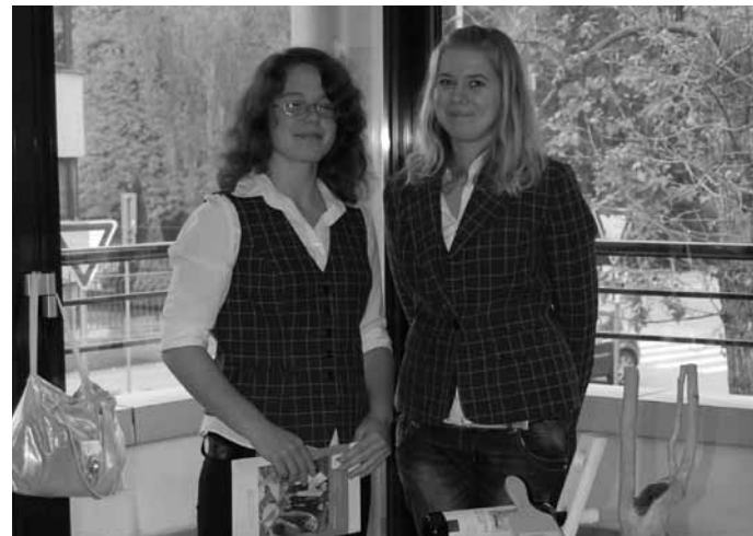
Študentky Spojenej školy z Turian Sú zapojené do projektu Zelená škola.

Text: Ľubomíra Masnicová.