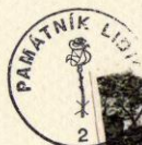
ředitelka Památníku Lidice