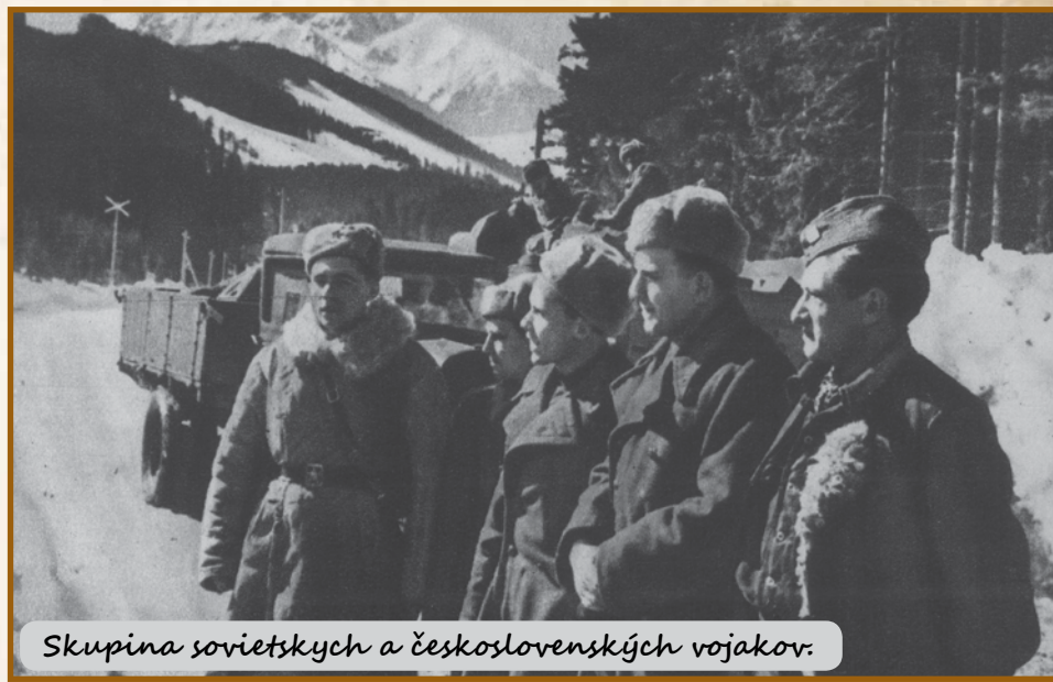
Skupina sovietskych a československých vojakov.

Po oslobodení Námestova postupovali vojská 154. pevnostnej brigády ďalej cez Lokcu na Starú a Novú Bystricu a cez Krásno nad Kysucou smerom na Čadcu. Najťažšie boje zvädzali o Novú Bystricu, kde za obeť padli i obyvatelia obce, ktorí vojakom nezištne pomáhali. Po prelomení nemeckej obrany pri Novej Bystrici vojská brigády ďalej pokračovali na Krásno nad Kysucou a Čadcu, odtiaľ