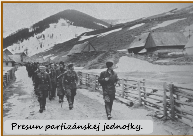
Presun partizánskej jednotky.

Nemecké jednotky ihneď prešli do protiútokov. Nasledovali ťažké boje o udržanie mesta až do 11. marca, kedy československé jednotky pod hrozbou obklúčenia museli