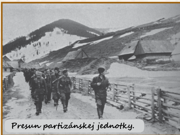
Presun partizánskej jednotky.

Nemecké jednotky ihneď prešli do protiútokov. Nasledovali ťažké boje o udržanie mesta až do 11. marca, kedy československé jednotky pod