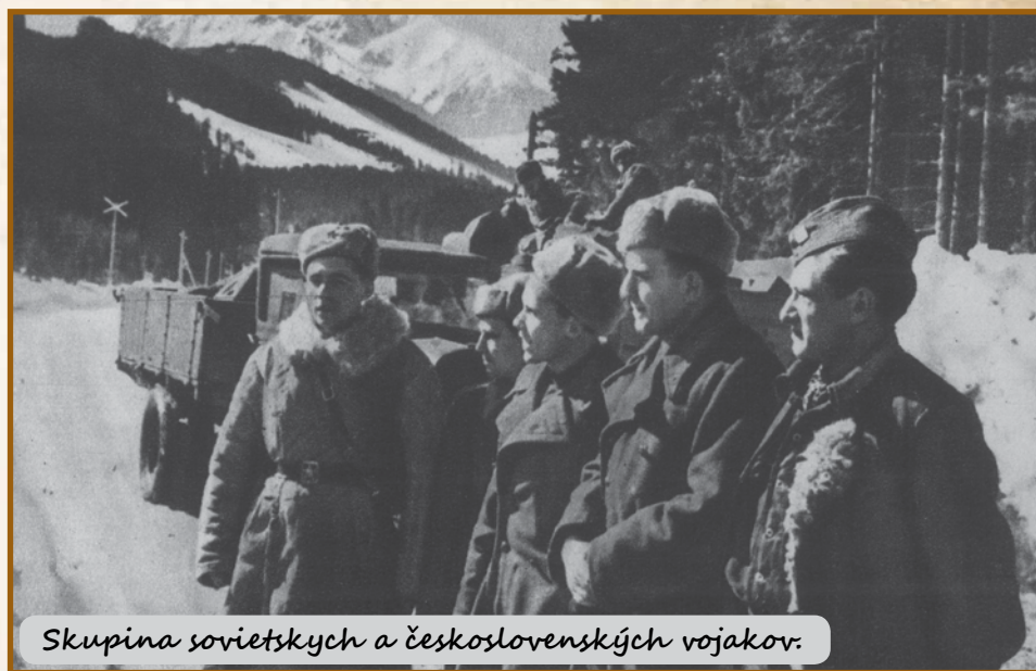
Skupina sovietskych a československých vojakov.

Po oslobodení Námestova postupovali vojská 154. pevnostnej brigády ďalej cez Lokcu na Starú a Novú Bystricu a cez Krásno nad Kysucou smerom na Čadcu. Najťažšie boje zvädzali o Novú Bystricu, kde za obeť padli i obyvatelia obce, ktorí vojakom nezištne pomáhali. Po prelomení nemeckej