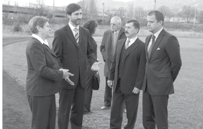
Obhliadka súčasného stavu areálu

organizáciám a klubom, a zabezpečí celoročnú prípravu hokejistov a hokejistiek. Na ihrisku vznikne atletický štadión s 8 dráhami, šprintérska rovinka dĺžky 110 m, obojstranný diaľkarský sektor, vodná priekopa, dva vrhačské a výškarské sektory. Futbalové ihrisko s novým