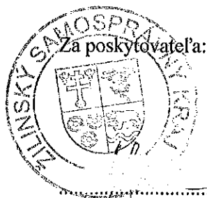
Ing. Juraja Blanár predseda