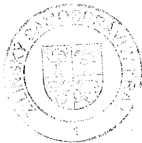
Ing. Juraj Blanár predseda