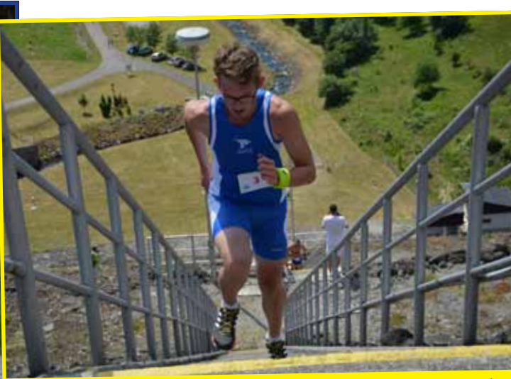
Beh okolo priehrady na Turčeku. Jediný beh na Slovensku, ktorého súčasťou je beh po schodoch priehradného múra, ktorých je až 373!