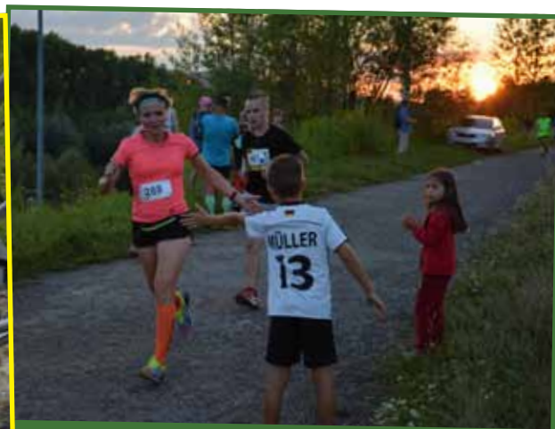
Takmer 430 bežcov odbehlo aj Žilinský večerný ROTARY beh, ktorý sčasti vedie po cyklotrase BikeKIA, spájajúcej dve dominanty Horného Považia – Hrad Budatín a Hrad Strečno.