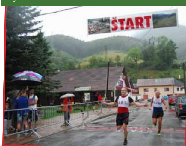
100 bežcov preverilo svoje schopnosti v daždi na pretekoch Belanská pätnástka v Ružomberku – Bielom Potoku.

Podrobnejšie info hľadaj na Facebooku Žilinská ŽupaRUN alebo na www.zuparun.sk