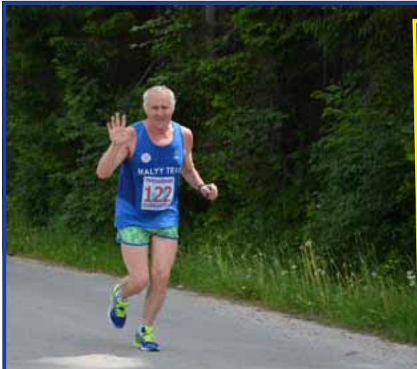
12 km trať Tvrdošinskej dvanástky zdolávalo 287 bežcov. Zaviedla ich aj k najväčšej vodnej ploche na Slovensku – Oravskej priehrade.