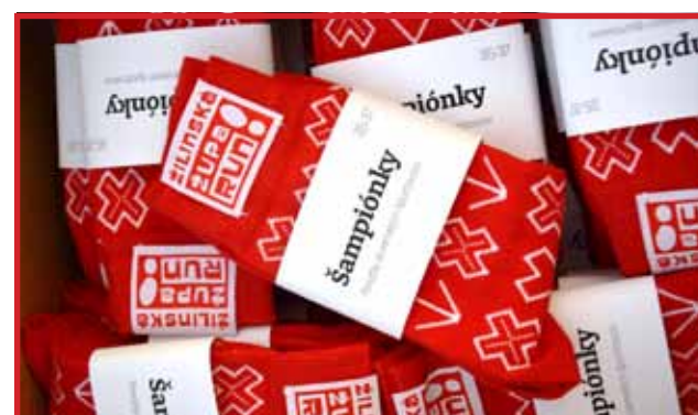
Motiváciou zúčastniť sa sú určite aj unikátne ponožky ŽupaRUN.

Župa ponúka pre behuťivých aj možnosť bezplatnej autobusovej dopravy na miesto pretekov. Zúčemcovia na INOV – 8 Beh súľovskými skalami a Krasňanskú desiatku sa môžu o časoch a mieste nástupu informovať na e-mailovej adrese eva.klimova@zilinskazupa.sk alebo na Facebooku Žilinská ŽupaRUN.