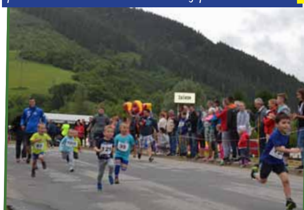
Dnes patrí Žaškovský minimaratón svojim 46. ročníkom bez prerušenia k dvadsiatim najstarším bežeckým pretekom na Slovensku. Z 303 pretekárov sa oravskej prírody nezľakli ani tí najmenší.