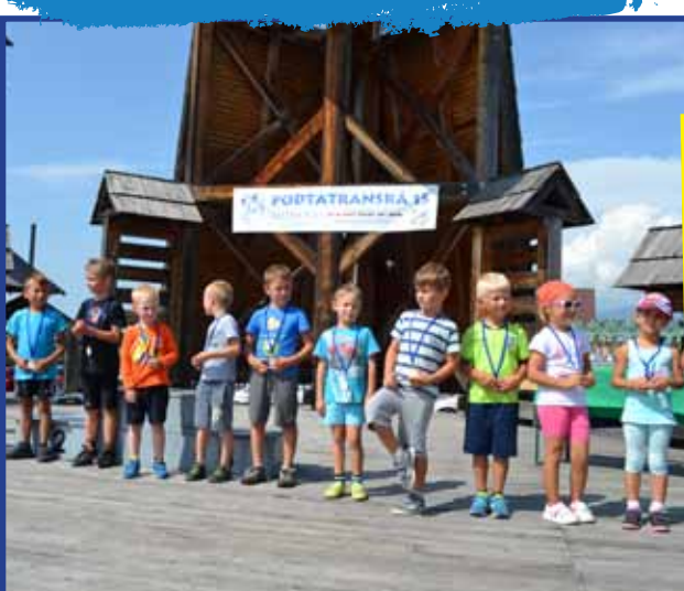
Liptov hostil aj 7. preteky ŽupaRUN – Podtatranskú pätnástku. Bežci si mohli vychutnávať očarujúcu prírodu medzi našimi najvyššími pohoriami – Tatrami a Nízkyimi Tatrami.

Podrobnejšie info hľadaj na Facebooku Žilinská ŽupaRUN alebo na www.zuparun.sk