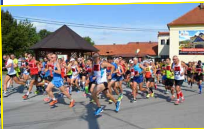
Zastávkou ŽupaRUN bola aj Blatnica a už 40. ročník Behu Gaderskou dolinou, považovaný za jednu z najkrajších dolín na Slovensku. Počas behu si bežci môžu všimnúť zaujímavé skalné útvary v doline alebo vodné mlynčeky na Gaderskom potoku.