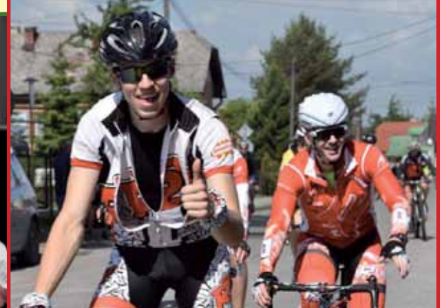
49. ročník medzinárodného cykloturistického podujatia Okolo Tatier patrí medzi najvýznamnejšie cykloudalosti v regióne.