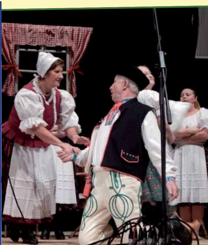
Speváčka folklórna skupina Orava z Dolného Kubína zakúpila v minulom roku vďaka získaným financiám 21 párov nových číziem pre speváčky aj tanečníkov.