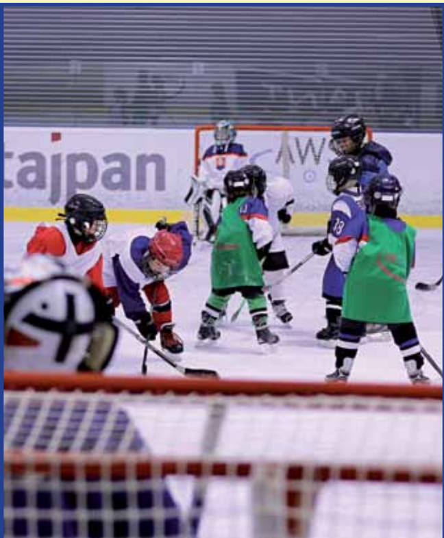
Žilinská župa podporuje aj športové talenty. Deti z Oravy majú možnosť rozvíjať svoje športové nadanie v ľadovom hokeji aj vďaka tomu, že Hokejový klub v Námestove úspešne využíva dotácie na svoju činnosť.

Druhá výzva vyhlásená na tento rok je zameraná na oblasť kultúry, pričom zahŕňa rôznorodé podujatia, a tiež činnosť občianskych združení, folklórnych súborov či iných záujmových skupín, ktoré vytvárajú pestrú mozaiku kultúrneho a spoločenského života v regiónoch kraja. Žiadatelia sa tak môžu uchádzať o finančnú podporu na organizáciu festivalov, prehliadok umenia, ale aj odborných konferencií, seminárov, workshopov či výstav zameraných na podporu a šírenie tradícií. V rámci výzvy je možné získať financie na vydávanie tlačených publikácií či CD nosičov. Medzi oblasti zahrnuté do výzvy patrí tiež kultúrny turizmus a s ním súvisiaca propagácia jedinečných kultúrnych pamiatok a zaujímavostí nášho Žilinského kraja.