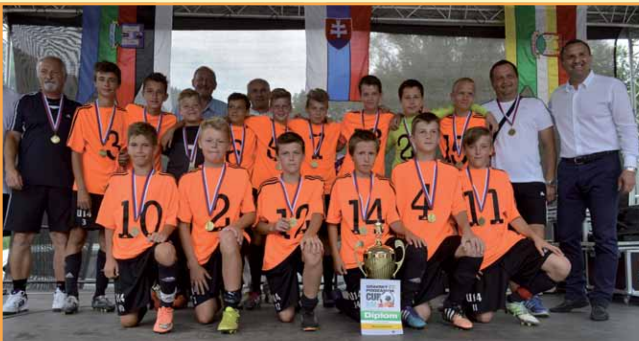
Oravský Podzámok Cup 2016. Podujatie sa podarilo v minulom roku zorganizovať aj vďaka dotáciám z grantového systému ŽSK.